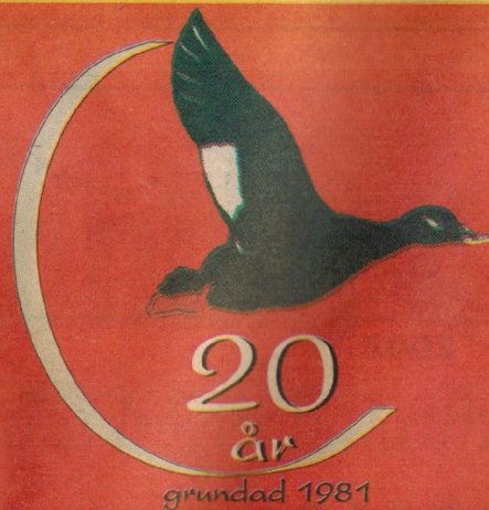
Sidan 10